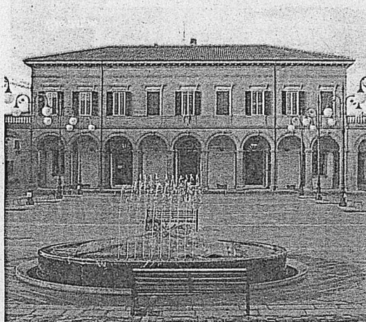
Il palazzo comunale di Sogliano e la sindaca Tania Bocchini