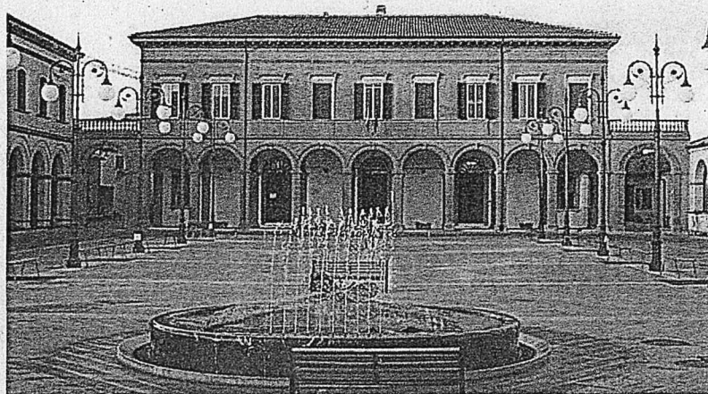
La ex scuola di Sogliano

La giunta regionale aveva previsto dei fondi a sostegno dei processi di partecipazione degli enti locali, altri soggetti pubblici e soggetti giuridici privati, ossia associazioni, comitati, cooperative, purché avessero ottenuto l'adesione formale dell'ente responsabile