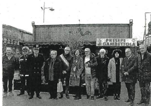
L'inaugurazione del presepe meccanico di Gambettola

Ieri pomeriggio ha aperto il presepe Sparaventi di fianco