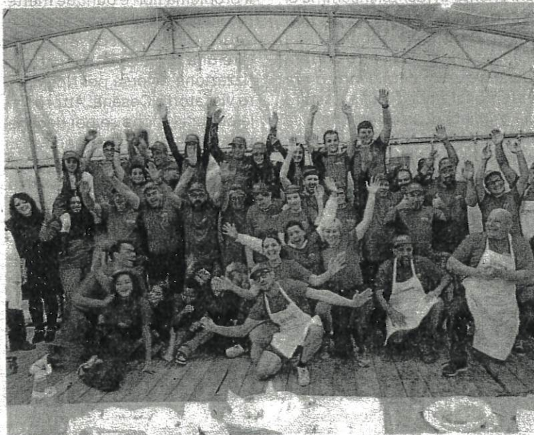
I volontari della Sagra del Savor di Montegelli di Sogliano al Rubicone

La bella stagione ha contribuito in modo determinante al grande exploit della XXXIV sagra del Savor, la manifestazione di Montegelli di Sogliano al Rubicone, che riporta antichi sapori del passato. La frazione, che conta circa 100 abitanti, nei tre giorni e serate della sagra è stata presa d'assalto da oltre 5.000 persone alle quali è stato offerto gratuitamente, in assaggio, più di un quintale di Savor, la prelibata e unica marmellata con una base di succo d'uva, che viene bollita dopo avere sapientemente aggiunto un misto ben tritato di mele cotogne, pere e mandorle, cotto per 8-10 ore a fuoco lento. Dice Stefano Gozzi, presidente dell'associazione culturale Montegelli: «Una marmellata che piace moltissimo. Nei tre giorni di sagra sono stati venduti oltre mille vasetti di Savor, insieme a quelli di Saba. I frequentatori della sagra del Savor hanno potuto anche visitare le varie mostre: 'La casa dei ricordi' e 'Il canto del telaio', mercatino di beneficenza con in vendita piccoli oggetti confezionati dalle donne e dai bambini del paese il cui ricavato sarà devoluto in beneficenza, il carrellino dei lupini per ritrovare il sapore delle sagre di una volta. Il comitato organizzatore ha offerto gratuitamente in assaggio il Mastlaz, vino primaticcio, ricco di zuccheri che un tempo colmava il periodo di vuoto fra la fi-