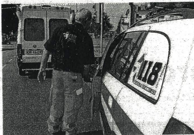
Un intervento del 118 (foto di repertorio)

Su tutta la vicenda il cittadino sollecita comunque un'indagine si domanda: «Come dovrei comportarmi se dovessi ritrovarmi in futuro in una situazione simile? Ossia di risposta negativa ad intervenire da parte della guardia medica e ritardo di primo soccorso». Circostanziata anche la risposta dell'Ausl Romagna. «L'azienda Usi della Romagna, effettuate le dovute e necessarie verifiche su quanto