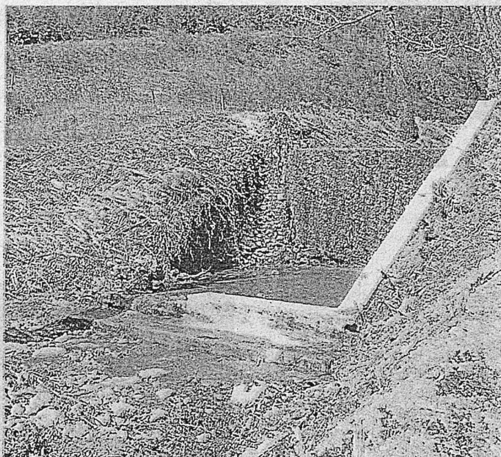
La briglia Fosso Barattoni prima dell'intervento

La Regione Emilia Romagna ha finanziato i lavori con 41.670 euro