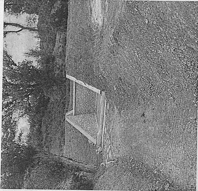
L'intervento completato alla briglia del fosso Barattoni

montane è un tema importante per il Consorzio di Bonifica della Romagna - sotto linea Stefano Francia, presidente dell'ente - in questi territori fragili la sinergia tra Consorzio e Comuni è importantissima: insieme dobbiamo promuovere la cultura della cura preventiva del territorio, che si attua con manutenzioni capillari, programmate, periodiche per superare la purtroppo consolidata cultura dell'emergenza».