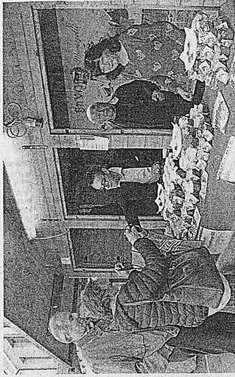
Lo stand del Savor