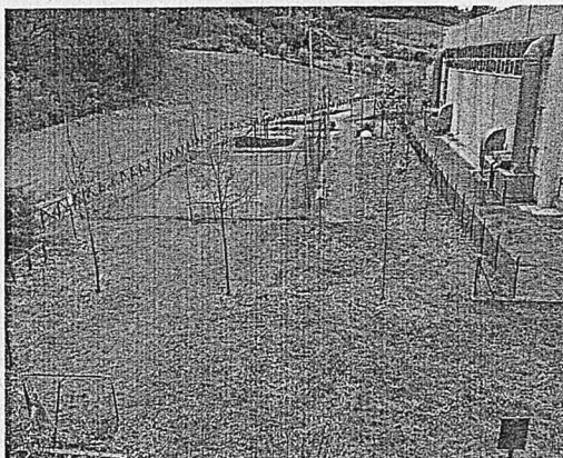
L'area Interessata a Bivio Montegelli

È stata quindi inviata una petizione alla sindaca di Sogliano. «Si tratta di un documento con la raccolta firma con 40 famiglie contrarie alla variazione del progetto