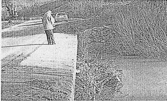
Il ponte raso sul fiume Uso e i detriti che ostacolano il deflusso dell'acqua

Non sono bastati una trentina di straripamenti e di allagamenti in quindici anni per fare intervenire gli enti preposti e sistemare un'assurda situazione che ha dell'incredibile è che sta facendo arrabbiare gli utenti della trafficatissima provinciale 13 Uso che attraversa i territori di Borghi e Sogliano al Rubicone che chiedono che la circonvallazione camionabile della frazione di Masrola venga messa in sicurezza nel punto dove c'è il ponte a raso sul fiume Uso. E sono proprio gli abitanti di Masrola a dire: «Occorre portare via quella montagna di detriti, fatti di tronchi d'albero, rami, massi di cemento e catrame che impediscono il normale deflusso dell'acqua sotto il ponte. L'acqua trovando ostacoli e non passando sotto il ponte scava cunicoli ai lati e poi tutto crolla. Abbiamo paura di allagamenti in caso di forti e prolungate piogge». Anche se l'inverno è stato mite e pochissima l'acqua e la neve cadute, tanti abitanti