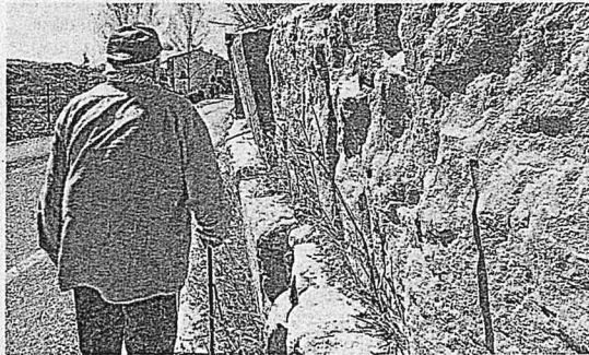
La frana che avanza alle porte di Ponte Uso di Sogliano al Rubicone

Cinque anni fa furono eseguiti, dopo altri quattro di attesa, i lavori di ripristino e consolidamento del muro di cinta per bloccare il movimento franoso in atto alle porte del paese. Nove anni fa una piccola parte di