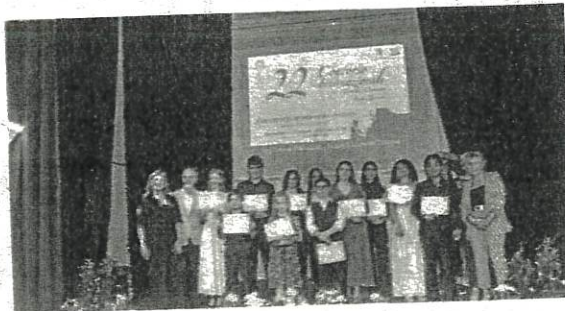
Una premiazione al concorso internazionale di Sogliano al Rubicone

Per quattordici giorni Sogliano al Rubicone si trasforma in una vera e propria palestra di giovani talenti musicali, accogliendo centinaia di musicisti provenienti da tutta Italia e dall'Europa. Dal 18 al 31 maggio 2026 torna per la 23ª Edizione consecutiva, il Concorso Internazionale «Luigi Zanuccoli», appuntamento ormai consolidato nel panorama musicale dedicato ai giovani interpreti. Anche quest'anno saranno numerosi i partecipanti che si esibiranno sul palco del Teatro Elisabetta Turroni. Il concorso si aprirà il 18 maggio con le esibizioni degli studenti delle scuole a indirizzo musicale provenienti da diverse regioni italiane. Seguiranno le sezioni dedicate ai solisti e la sezione speciale di canto lirico. Il montepremi complessivo ammonta a 15mila euro. Oltre alle borse di studio, fino a 2.500 euro, i vincitori riceveranno concerti premio e buoni acquisto per spartiti musicali e strumenti di studio. Anche per questa edizione il concorso si distingue per la presenza di una commis-