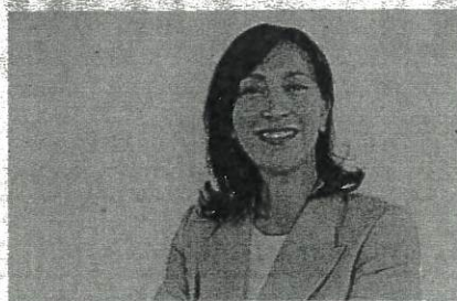
La sindaca di Sogliano, Tania Bocchini