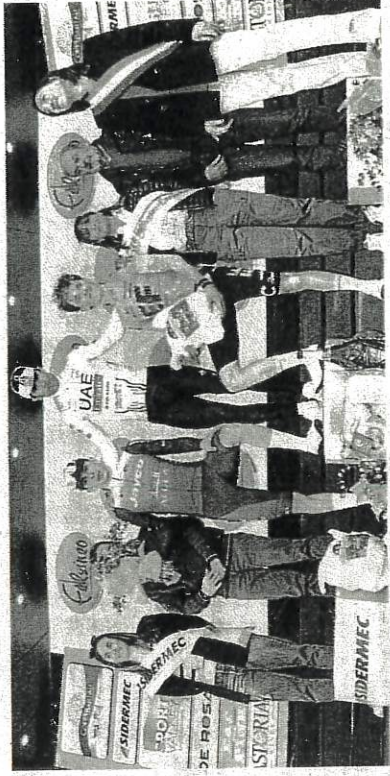
Il podio della seconda tappa della Settimana Internazionale Coppi e Bartali

Oggi la terza tappa prenderà il via nuovamente da Riccione, dove sarà posto anche il traguardo. Partenza alle 12 e arrivo su viale Milano attorno alle 15.30. Le fasi conclusive della gara saranno trasmesse in diretta streaming, dalle 14.40, sul sito tutto-biciweb.it, Rai Sport trasmetterà una sintesi a partire dalle ore 17, mentre sul sito www.gsemilia.it sarà possibile seguire la diretta testuale della tappa.